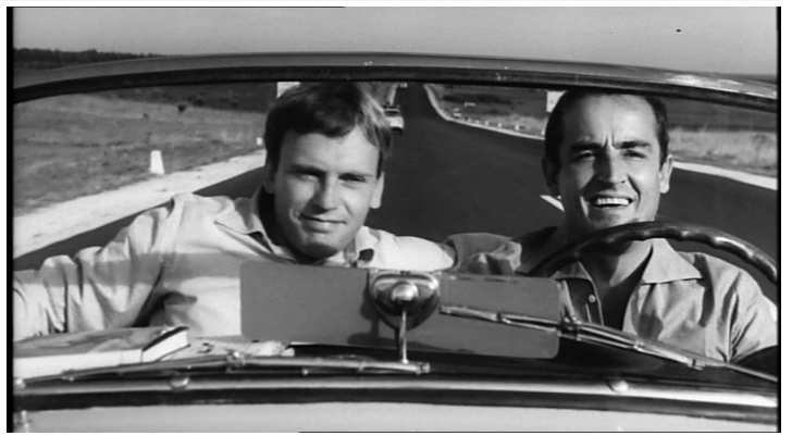
La strana coppia Trintignant/Gassman nel capolavoro "Il sorpasso" (1962)

RITRATTI D'AUTORE DEL GRANDE CINEMA ITALIANO: PRIMA PARTE